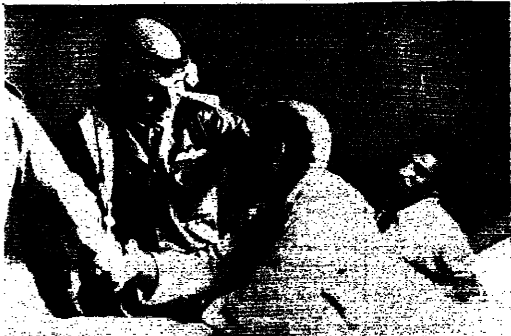
جلالة الملك المعظم بواسي جرحا في احد المستشفيات العسكرية خلال جواره التقنية

وقد انتخب جلالة الملك المعظم سو الأجر محمد المعظم لينوب عن جلالته في تشييع موكب الشهداء ، وقد جرى تشييع سبعة شهداء بعد صلاة الجمعة في المسجد الحسيني الكبري بمسجد إلى مقابر الشهداء في موكب رسمي وشعبي مهيب حيث كان يقود الحسين سمو الأمير محمد المعظم وموسيقى الجيش وجملة الكتليل . وما ان خرجت القوس السميعة المتجهة بالعلم الاردني حتى علا هتاف المواطنين الذين بلغ عددهم حوالي الخمسين ألف مواطن بالتهاويل